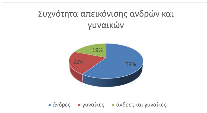
Σχήμα 1: Η συχνότητα απεικόνισης των φύλων στο βιβλίο

Αναφορικά με την πρώτη κατηγορία, δηλαδή τη συχνότητα εμφάνισης ανδρών και γυναικών στις εικόνες του βιβλίου, η έρευνα εντόπισε συνολικά 261 εικόνες στις οποίες απεικονίζονται πρόσωπα είτε ανδρών είτε γυναικών, είτε και ανδρών και γυναικών. Σε αυτές, το ανδρικό φύλο επικρατεί αριθμητικά, με μεγάλη διαφορά. Έτσι, σε 167 εικόνες απεικονίζονται άντρες, ενώ γυναίκες σε μόνο 53, μια αναλογία δηλαδή 3 προς 1. Τέλος, σε 49 από αυτές απεικονίζονται τόσο άντρες όσο και γυναίκες. Στο σχήμα 1, εμφανίζονται οι παραπάνω αριθμοί, ως ποσοστά του συνόλου των απεικονίσεων.