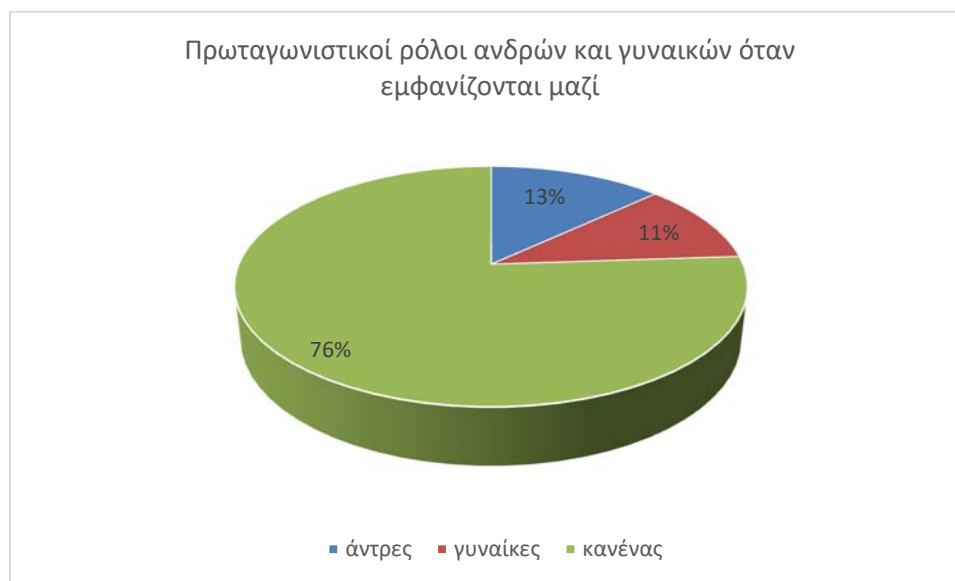
Σχήμα 4: Πρωταγωνιστικοί ρόλοι ανδρών και γυναικών στις κοινές απεικονίσεις

καθώς άντρες και γυναίκες μοιράζονται τους πρωταγωνιστικούς ρόλους σχεδόν ισότιμα, με μικρή υπεροχή των ανδρών, όπως φαίνεται στο σχήμα 4.