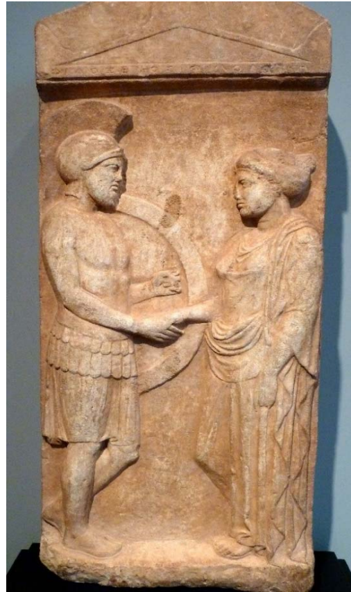
Εικ. 1: Επιτύμβια στήλη του Φιλοξένου. Εικονίζεται με τη σύζυγό του Φιλουμένη σε αποχαιρετισμό (δεξιωσιν), περ. 400 π.Χ. J. Paul Getty Museum.

Κατά τις επισκέψεις αυτές οι μαθητές μπορούν να επιχειρήσουν, με τη συνδρομή και την υποστήριξη του εκπαιδευτικού, την «ανάγνωση μνημείων», δηλαδή την ανάλυση της σημασίας και την ερμηνεία επιτύμβιων μνημείων (Εικ. 1΄ επίσης βλ. Παράρτημα 2: https://t.ly/Vors , Εικ. 1-13) και παραστάσεων αγγειογραφίας με σκηνές ταφικών τελετών (Εικ. 2΄ επίσης βλ. Παράρτημα 2: https://t.ly/n20l , Εικ. 14-35).