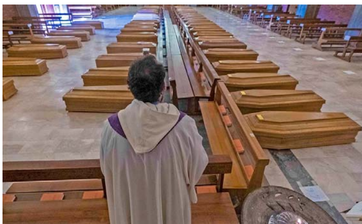
Εικ. 9: Εκκλησία γεμάτη φέρετρα με θύματα κορωνοϊού στο Μπέργκαμο της Ιταλίας, Μάρτιος 2020.

Γίνεται σαφές από τα παραπάνω ότι η ανάπτυξη μίας αγωγής θανάτου στη σύγχρονη Δευτεροβάθμια Εκπαίδευση είναι εντελώς απαραίτητη τόσο για γνωσιακούς–μαθησιακούς, όσο και για ψυχοκοινωνικούς και ψυχοπαιδαγωγικούς λόγους. Η εντρυφήση του εφήβου σε ζητήματα θανάτου, πένθους και θρήνου μέσω της σχολικής εκπαίδευσης θα επιτρέψει σε αυτόν να διαμορφώσει μία ρεαλιστικότερη αντίληψη γύρω από τον θάνατο, απαλλαγμένη από τις παραμορφωτικές εικόνες, στις οποίες τον υποβάλλουν οι σύγχρονες πηγές μαζικής πληροφόρησης. Επίσης, η προσέγγιση του θέματος μέσω της τέχνης και των γραμμάτων θα του προσφέρει τη δυνατότητα να συλλάβει το βαθύτερο νόημά του και να πραγματοποιήσει μία πρώτη βιωματική προσέγγιση σε αυτό, ανιχνεύοντας και εκφράζοντας τα αισθήματά του και εγκαταλείποντας έτσι την εσωστρέφεια, την οποία ενδεχομένως του δημιουργεί η αγωνία και ο φόβος. Πρόκειται για μία διαδικασία πρόσληψης του θανάτου υπό νέες συνθήκες νηφαλιότητας και ωριμότητας, η οποία μπορεί να λειτουργήσει ως πολύτιμη προπαρασκευή για την αντιμετώπιση εκ μέρους του μελλοντικών γεγονότων θανάτου στο οικείο περιβάλλον