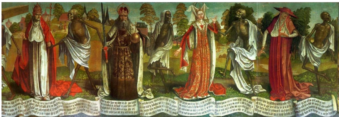
Εικ. 7: Λεπτομέρεια από τον «Χορό του Θανάτου (Danse Macabre)», τέλος 15ου αι., τοιχογραφία του Bernt Notke στην εκκλησία του Αγίου Νικολάου στο Ταλίν της Εσθονίας.