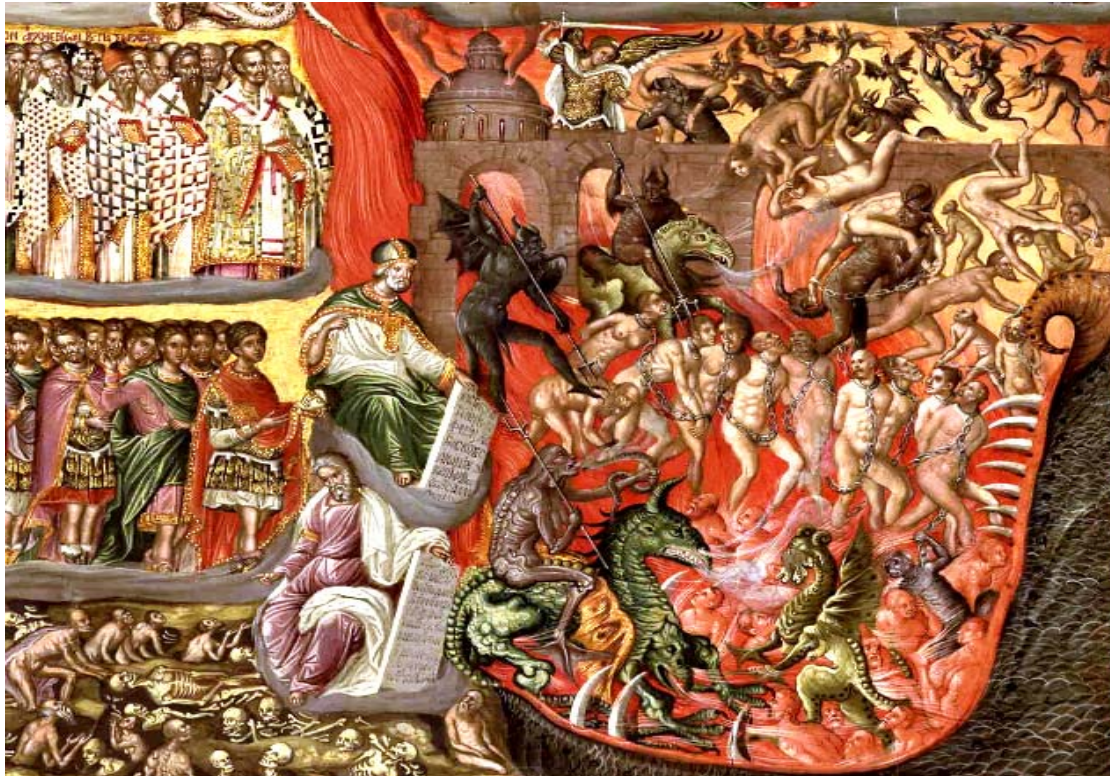
Εικ. 5: Λεπτομέρεια από έργο «Δευτέρα Παρουσία» του Γ. Κλόντζα. Εικονίζεται η κόλαση με την κάμινου του πυρός. Τέλη 16ου αι.

πλαίσιο αφενός της χριστιανικής πίστης, αφετέρου της φιλοσοφικής–θρησκευτικής σκέψης περισσότερων θρησκειών ποικίλων λαών από την αρχαιότητα έως σήμερα και φυσικά να επιδιωχθεί η εμβάθυνση στο συμβολικό και φιλοσοφικό περιεχόμενό τους.