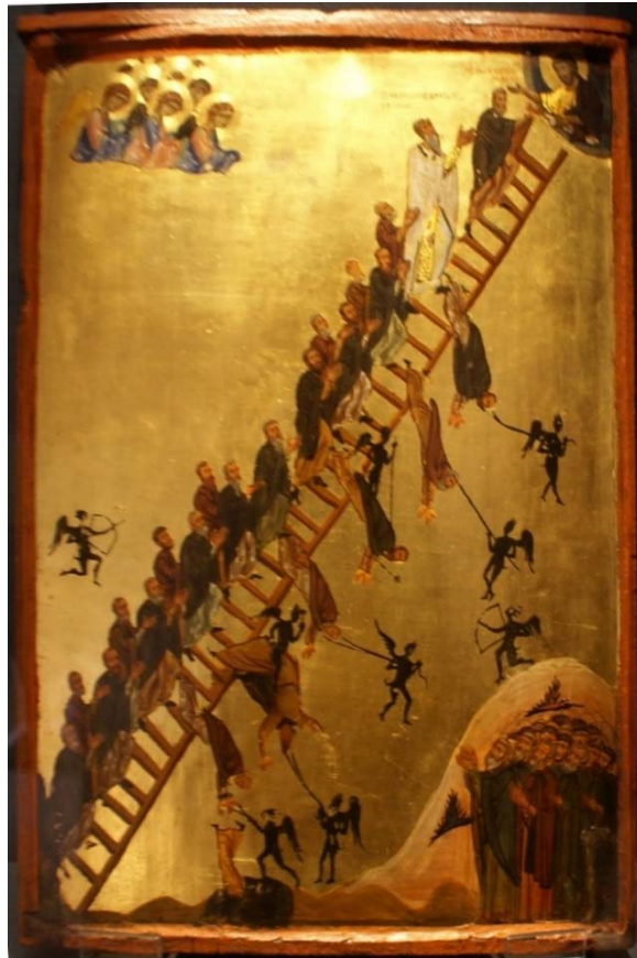
Εικ. 3: «Η Κλίμαξ της Θείας Ανόδου» του Αγίου Ιωάννη του Σιναΐτη, 12ος αι., Μονή της Αγίας Αικατερίνης του όρους Σινά.

Στη Β' Γυμνασίου και τη Β' Λυκείου οι μαθητές έχουν την ευκαιρία, μέσω του μαθήματος της Μεσαιωνικής και Νεότερης Ιστορίας και της Ιστορίας του Μεσαιωνικού και του Νεότερου Κόσμου αντίστοιχα, να πραγματευθούν την εξέλιξη των αντιλήψεων περί του θανάτου στον Μεσαίωνα και στους Νεότερους Χρόνους.