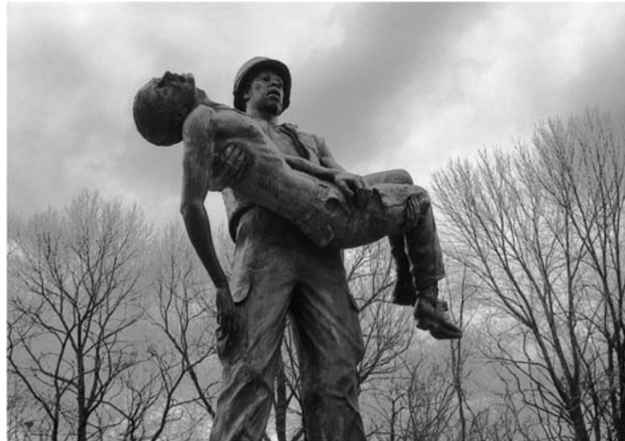
Εικ. 8: «Βιετνάμ». Γλυπτό του Charles Parks, 1983.

Όλες οι παραπάνω προσεγγίσεις, είτε λάβουν χώρα εμβόλιμα σε κάθε ευκαιρία που αναδεικνύεται από την ύλη των μαθημάτων, είτε αναπτυχθούν στο πλαίσιο ενός Πολιτιστικού Προγράμματος, θα εξοικειώσουν τους μαθητές με την πολισιχιδία που παρουσιάζει η προσέγγιση των πολιτισμών επί του θέματος ανά τους αιώνες. Μάλιστα, σε τάξεις με μεικτό εθνολογικά ή θρησκευτικά πληθυσμό μπορεί να ανατεθεί η παρουσίαση ηθών και εθίμων από την χώρα προέλευσής τους ή την θρησκεία τους, προκειμένου να αναζητηθούν διαφορές και ομοιότητες στον τρόπο με τον οποίο οι διάφοροι λαοί προσλαμβάνουν, πραγματεύονται και, τελικά, αντιμετωπίζουν τον θάνατο.