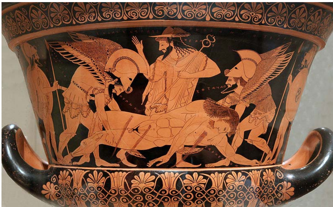
Εικ. 2: Λεπτομέρεια από τον κρατήρα του Ευφρονίου. Εικονίζονται ο Ύπνος και ο Θάνατος που μεταφέρουν το σώμα του νεκρού Σαρπηδόνα έξω από το πεδίο της μάχης. Παρίσταται ο Ερμής. 515 π.Χ. Metropolitan Art Museum, New York.