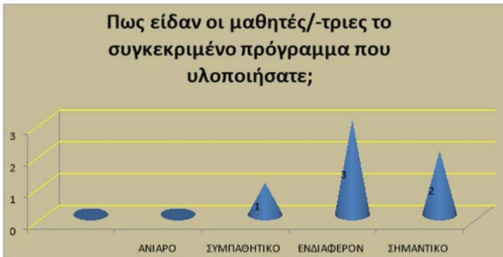
Εικόνα 1: Αξιολόγηση του προγράμματος

eTwinning» και οι έξι (6) εκπαιδευτικοί απάντησαν θετικά. Στο προτελευταίο ερώτημα τέθηκε το ζήτημα «αν στο μέλλον θα υλοποιούσαν ένα ακόμη πρόγραμμα eTwinning» όλοι απάντησαν θετικά (εικόνα 2). Τέλος, στο ερώτημα «τι σημαίνει για εσάς eTwinning» λάβαμε τις παρακάτω απαντήσεις και από τους έξι (6) εκπαιδευτικούς: «Δίνει ευκαιρίες για συνεργασία μαθητών και εκπαιδευτικών, αλλά και ανταλλαγή εμπειριών και γνώσεων. Εμπειρίες, δημιουργικότητα, γνωριμία με άλλες κουλτούρες, συνεργασία, φιλίες. Μια υπέροχη πλατφόρμα μάθησης τόσο για τα παιδιά όσο και για τους εκπαιδευτικούς. Μια εξαιρετική ευκαιρία μέσω υλοποίησης κάποιου έργου να μάθουν όλοι, να συνεργαστούν με διαφορετικό τρόπο από αυτόν της τάξης, ένα είδος ηλεκτρονικής αδελφοποίησης μεταξύ των σχολικών μονάδων–και να αισθανθούν πως είναι μέλη μιας κοινότητας σχολείων της Ευρώπης. Συνεργασία, γνωριμία, επικοινωνία. Απόκτηση καινούριων εμπειριών και ενδιαφερόντων. Συνεργασία, συναδελφικότητα, καλές πρακτικές».