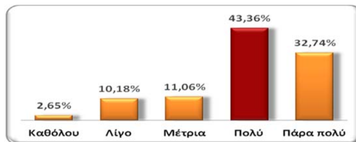
Σχήμα 1.1: Διασφάλιση ισότιμης συμμετοχής μαθητών/τριών στην εκπαίδευση

Από τις απαντήσεις προέκυψαν τα εξής δεδομένα: